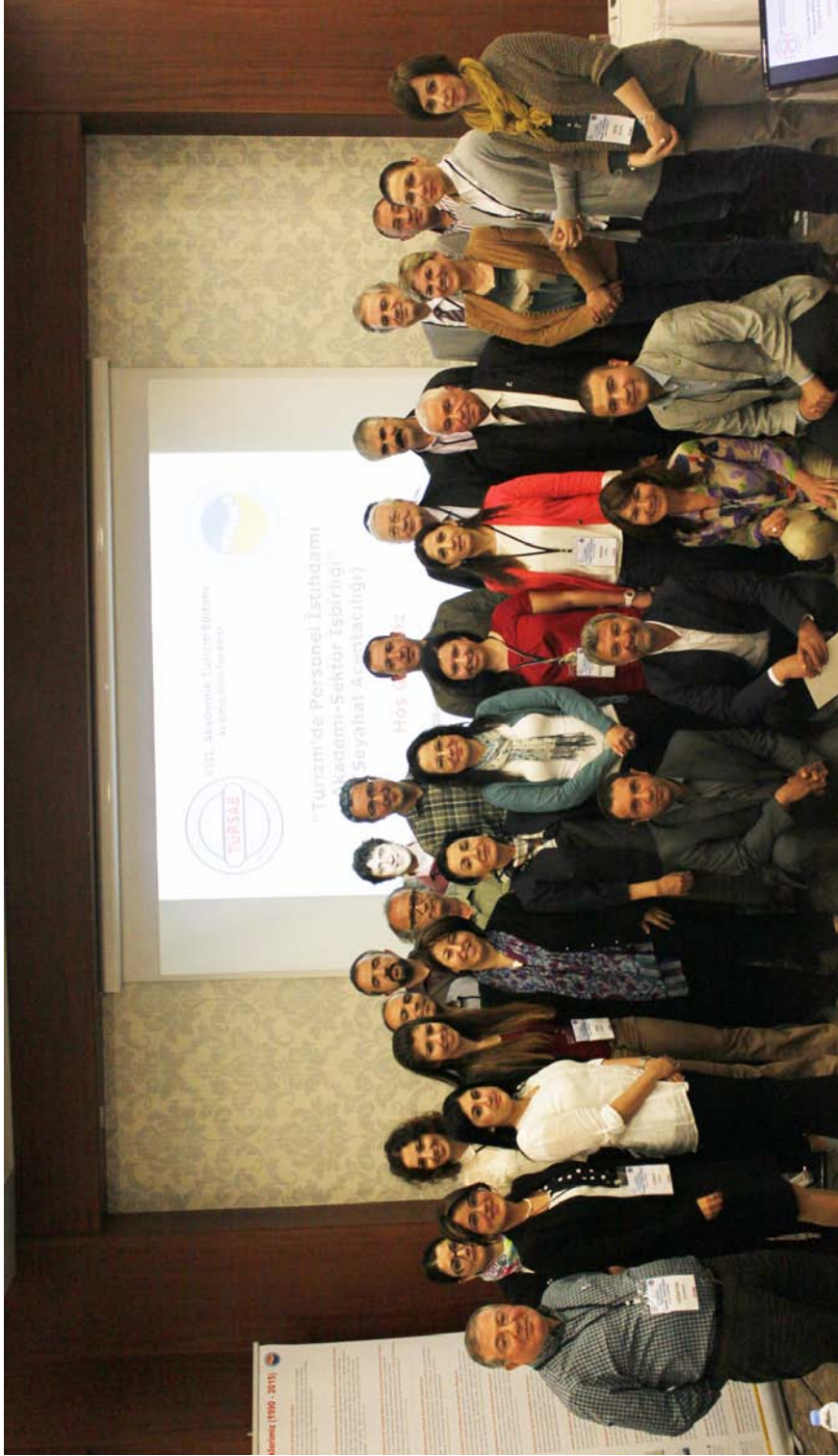
8. Akademik Eğitimi Arama Konferansı katılımcıları toplu halde