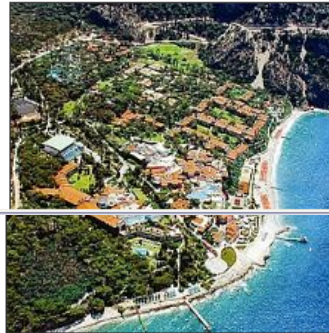
Lykia World Ölüdeniz önemli toplantıya ev sahipliği yapacak

Muğla Üniversitesi Turizm İşletmeciliği ve Otelcilik Yüksekokulu tarafından ilki geçen yıl gerçekleştirilen Akademik Turizm Eğitimi Arama Konferansı'nın ikincisi, 22-25 Nisan 2010 tarihleri arasında Fethiye LykiaWorld Ölüdeniz Hotel 'de düzenleniyor.